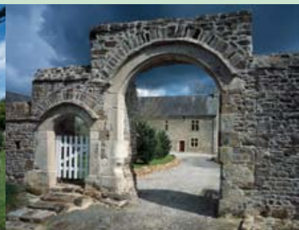
Le Plessis-Lastelle, la Maison-Neuve, manoir de la 1 re moitié du XVII e siècle. © Photo Pascal Corbierre, 2004.

La recherche a porté sur un espace occupé pour 1/5 par des marais caractérisés par une submersion hivernale. Ce secteur a longtemps connu une activité