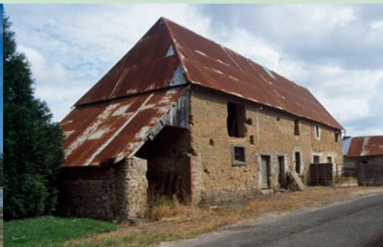
Raids, ferme de la Herveurie.

A vec les années 2000, les territoires des études topographiques évoluent et s'adaptent aux nouvelles réalités politico-administratives : ainsi, dans la Manche, l'Inventaire a mené une étude sur la Communauté de communes de Sèves-Taute (12 communes), en partenariat avec le Parc naturel régional des marais du Cotentin et du Bessin, le Pays d'art et d'histoire de Coutances et la Conservation des antiquités et objets d'art de la Manche.