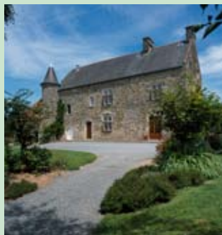
Marchésieux, manoir de la Ventinière, XVI e siècle.