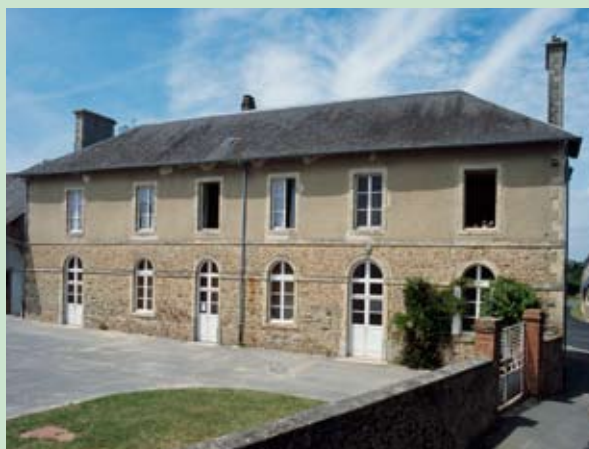
Marchésieux, école construite au XIX e siècle.