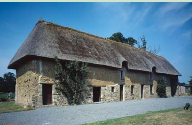
Marchésieux, ferme des Marais.