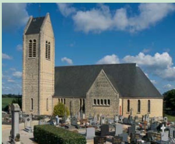
Raids, église Saint-Georges, architecture de la Reconstruction, 1960.