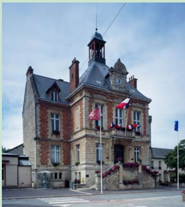
Périers, hôtel de ville, 1875.