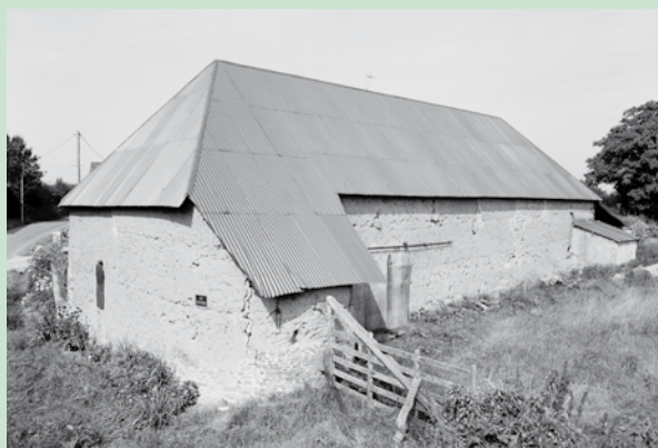
Marchésieux, bâtiment du pressoir.