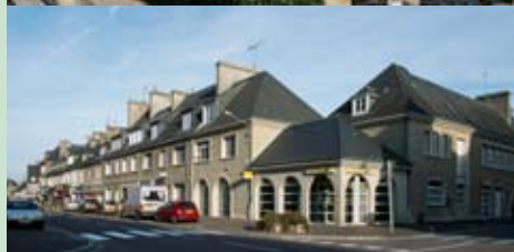
Périers, rue de Saint-Lô, architecture de la Reconstruction.