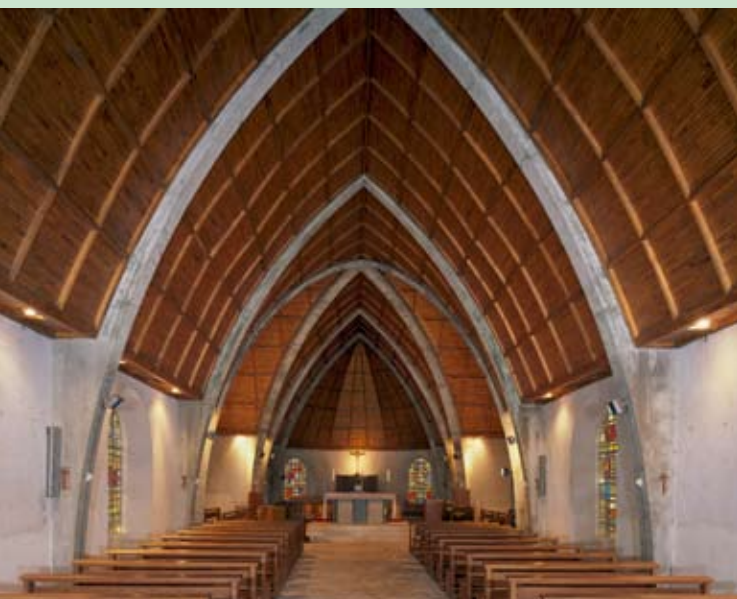
Le Plessis-Lastelle, chœur de l'église Saint-Sébastien reconstruite par Jean Michalon en 1958.

À l'issue de cette opération, a été entreprise une campagne d'inventaire thématique du bâti en terre sur l'ensemble du territoire du Parc naturel régional des marais du Cotentin et du Bessin.