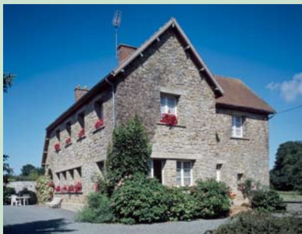
Raids, ferme de la Fosse par l'architecte Pierre-André Lebreton vers 1950.

Trois types d'architecture ont été identifiés :