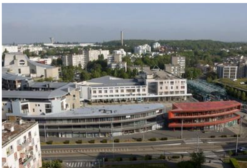
Hérouville-Saint-Clair, une ville-musée : les deux édifices de l'architecte Jean Nouvel et la « forêt d'émeraude » de l'agence TETRAC, terminus du tramway