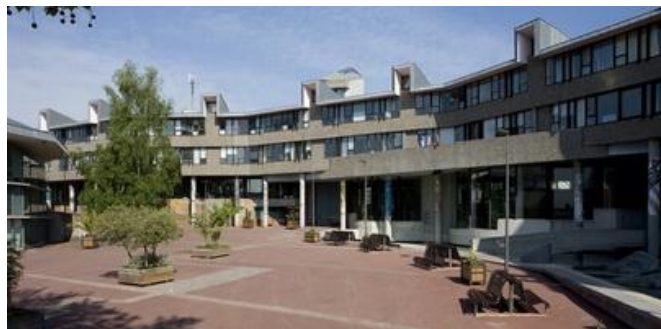
Bâtiment de l'hôtel de ville, d'inspiration médiévale

Parmi les 119 projets proposés, c'est finalement celui de l'architecte saint-lois Eugène Leseney qui est retenu, avec sa « Citadelle douce », véritable place fermée de béton et granit. Elle rassemble les services publics et culturels (hôtel de ville, cinéma, théâtre, poste, Centre d'Art Contemporain).