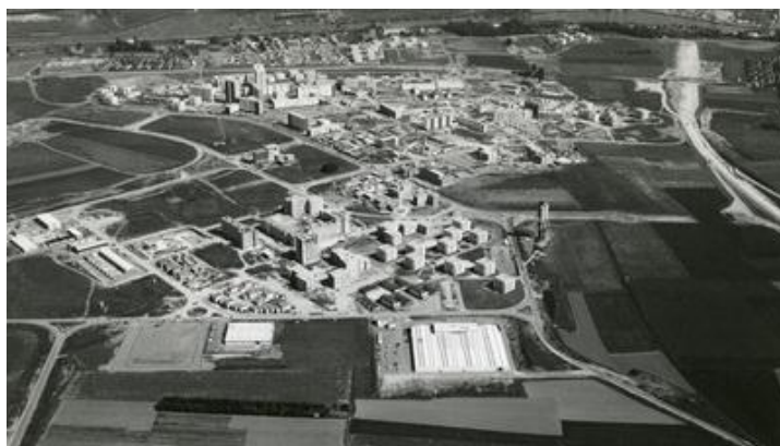
La ville en construction

A l'issue de la sélection, c'est un cabinet parisien, l'Union des Architectes Urbanistes, qui est choisi pour concevoir le plan d'urbanisme. La réalisation de 4 quartiers est confiée à 4 autres agences.