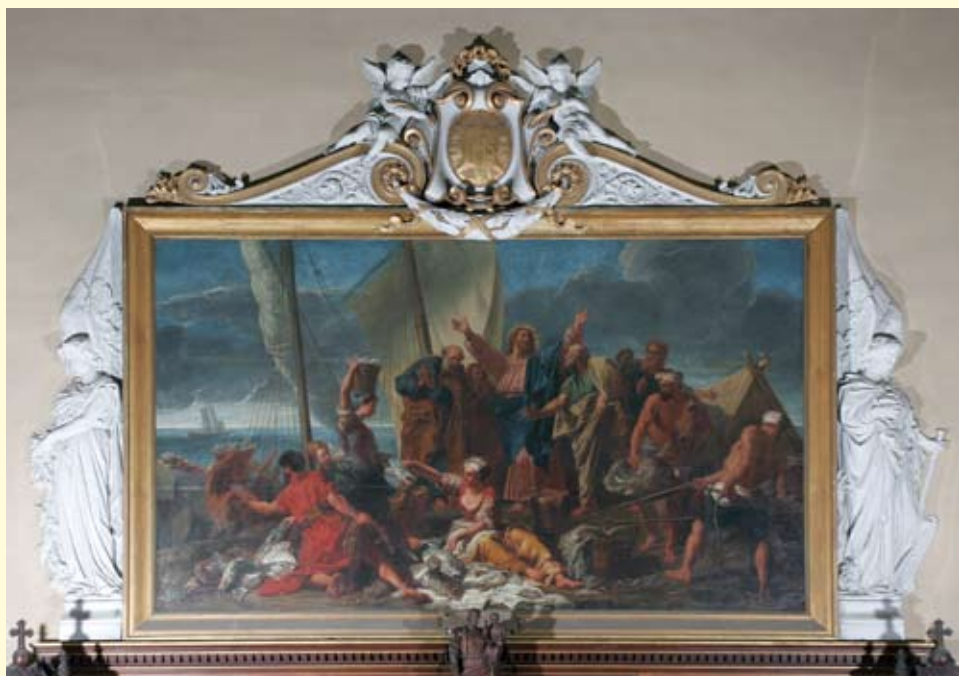
Trouville-sur-Mer, église Notre-Dame-des-Victoires, Pêche miraculeuse , d'après le tableau de Jean Jouvenet exécuté en 1706 pour l'église Saint-Martin-des-Champs à Paris, saisi à la Révolution puis entré au musée du Louvre. Peinte par Marie Wagrez vers 1855, cette copie est une des nombreuses commandes de l'État au XIX e siècle. En encourageant la copie des grands maîtres, l'État participait ainsi à l'apprentissage des jeunes peintres et leur apportait un secours financier.

Limitée à la peinture religieuse, l'enquête doit notamment aboutir à une réflexion sur la place de la copie, aider à comprendre le sens des images religieuses et faire émerger des artistes locaux jusque-là peu ou mal connus.