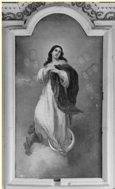
Montreuil-la-Cambe, église paroissiale Saint-Aubin, Immaculée Conception , signée Ricoy. Copie par le peintre L. Ricoy, actif dans l'Orne dans la seconde moitié du XIX e siècle, de l'œuvre de Bartolomé Murillo conservée au musée du Louvre entre 1852 et 1941 et actuellement au musée du Prado à Madrid. Les Vierges de Murillo comptent parmi les toiles les plus reproduites dans les églises de France.