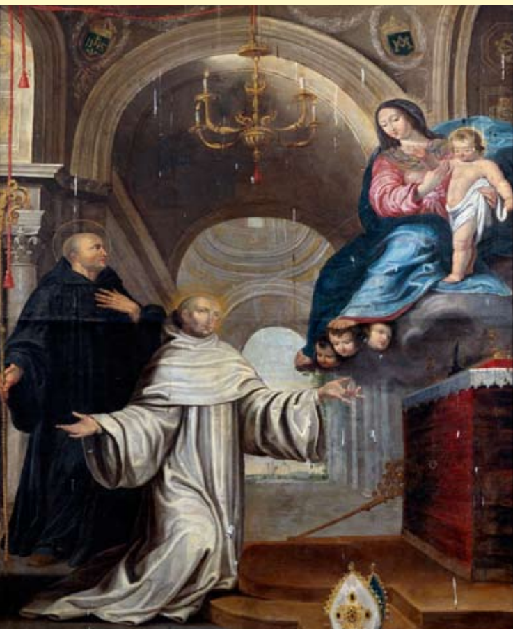
Montreuil-en-Auge, église paroissiale Saint-Roch, Le Miracle de la lactation de Saint-Bernard. « Montrez que vous êtes notre Mère » : à ces mots de Bernard de Clairvaux en prière devant une statue de la Vierge, quelques gouttes de lait jaillirent du sein de la Vierge et vinrent humecter les lèvres du fervent propagateur du culte de Marie. Cette iconographie est plus répandue dans la peinture baroque espagnole, flamande ou allemande que dans la production française. Le tableau exécuté en 1665 a été donné à l'église de Montreuil lors du démantèlement de l'abbaye cistercienne du Val-Richer à la Révolution.