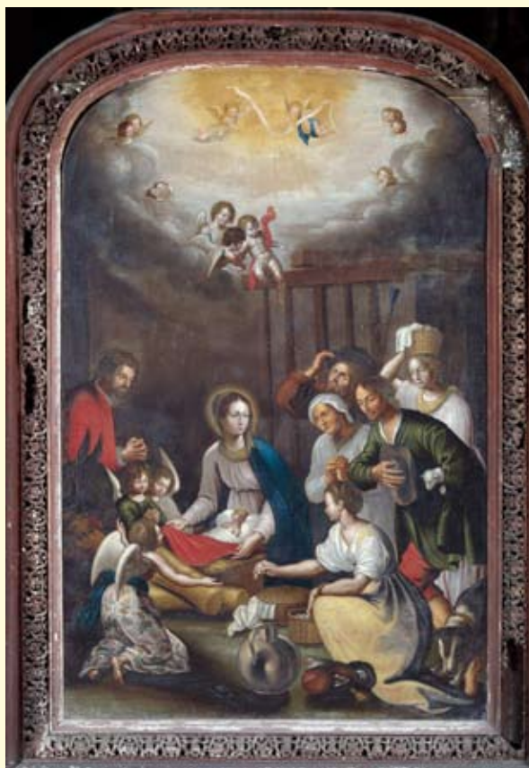
Falaise, église Saint-Gervais, Adoration des bergers . Copie du 2 e quart du XVIII e siècle du tableau de Pierre-Paul Rubens actuellement conservé au musée des Beaux-Arts de Rouen. Il s'agit d'une copie inversée car l'artiste a travaillé à partir de la gravure, largement diffusée, de Lucas Vosterman, datée de 1620. Le peintre a librement interprété la gravure en ajoutant trois anges agenouillés au pied de l'enfant et en modifiant la Vierge qui, à l'origine, donnait le sein à son fils. Le cadre en bois sculpté ajouré est caractéristique du décor normand du milieu du XVIII e siècle.