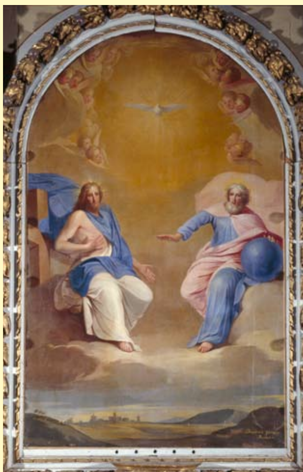
Ticheville, église paroissiale Saint-Pierre, La Trinité . Signée Jouvenet pinxit Rouen , cette toile que l'on peut dater de la fin du xiii e siècle pourrait être l'œuvre d'un artiste apparenté à Jean Jouvenet, l'un des grands peintres du règne de Louis XIV.

E n partenariat avec les Conservations des antiquités et objets d'art du Calvados, de la Manche et de l'Orne (Conseils généraux) et la Conservation régionale des Monuments historiques (DRAC, ministère de la Culture), l'Inventaire vient d'entamer une étude sur la peinture de chevalet du xvi e au xx e siècle dans les églises de Basse-Normandie. Le choix d'une thématique régionale répond au vœu de mener un travail approfondi à partir des inventaires déjà réalisés par chacun des services et de donner une ampleur nationale à un projet qui valorise l'échelon local.