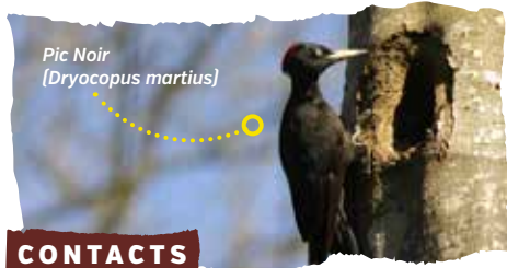
Pic Noir ( Dryocopus martius )

Conservatoire d'espaces naturels Normandie Seine Rue Pierre de Coubertin BP 424 76805 Saint-Etienne-du-Rouvray 02.35.65.47.10 http://cen-normandie.fr conservatoiredespacesnaturels @cren-haute-normandie.com