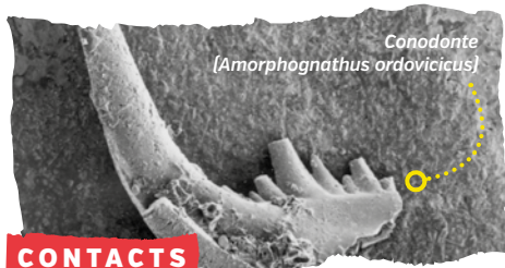
Conodonte ( Amorphognathus ordovicicus )

Groupe Ornithologique Normand 181 rue d'Auge 14000 Caen 02.31.43.52.56 www.gonm.org secretariat@gonm.org