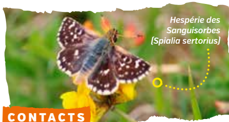
Hespérie des Sanguisorbes ( Spialia sertorius )

Parc naturel régional Normandie-Maine Le Chapitre BP 05 61320 Carrouges 02.33.81.75.75 www.parc-naturel-normandie-maine.fr info@parc-normandie-maine.fr