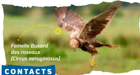
Femelle Busard des roseaux ( Circus aeruginosus )

Conservatoire d'espaces naturels Normandie Ouest 320 quartier du Val 14200 Hérouville Saint-Clair 02.31.53.01.05 cen-normandie.fr contact@cen-bn.fr