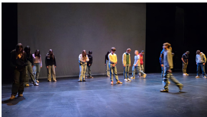
Légende : Prix Godot

Le Prix Femina des lycéens (Sélection de 10 romans de la rentrée littéraire) est organisé en partenariat avec les membres du jury du prix Femina et le réseau des libraires indépendants de Normandie. Il vise à développer chez les jeunes le goût et la pratique de la lecture, ainsi que la découverte de la littérature contemporaine. Il prévoit des interventions d'auteurs, « une délibération », une rencontre des élèves avec les membres du jury et une remise de prix. Il permet de découvrir des prix de la rentrée littéraires et des enjeux.