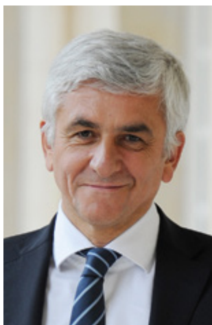
Hervé Morin, Président de la Région Normandie