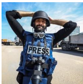
Motaz AZAÏZA © Instagram

Le Prix Liberté a pour but de rendre hommage à celles et ceux qui défendent la liberté et la paix dans le monde. Particularité de ce prix, il implique la jeunesse d'un bout à l'autre du processus : de la sélection des combats à la désignation du lauréat jusqu'à la remise de prix lors de la cérémonie.