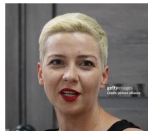
Maria KOLESNIKOVA

Le vote en ligne du Prix Liberté 2024 est ouvert aux jeunes de 15 à 25 ans du monde entier du 20 mars au 30 avril , pour élire le ou la lauréate de leur choix sur le site :